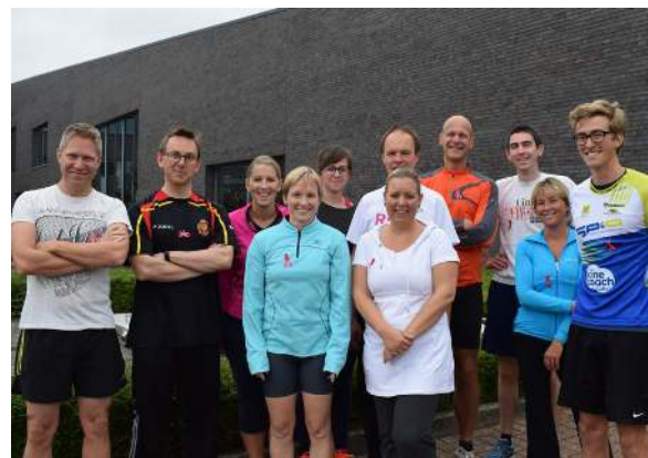
Het gemeentepersoneel zet zich deze maand extra in.